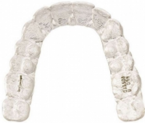
_ Durchsichtige Aligner von Invisalign

Das Invisalign-System ist eine revolutionäre Behandlungsmethode aus den USA, die es Patienten endlich ermöglicht, Zahnfehlstellungen nahezu unsichtbar und komfortabel korrigieren zu lassen. Die glasklaren, hauchdünnen Kunststoffschienen (Aligner) des Invisalign-Systems bewegen die Zähne Schritt für Schritt. Einmal eingesetzt sind sie von Außenstehenden kaum zu sehen und können zum Essen und zur Mundpflege herausgenommen werden. Speziell für Erwachsene und anspruchsvolle Jugendliche stellt das Invisalign-System eine ästhetische Alternative zu herkömmlichen Zahnspangen dar.