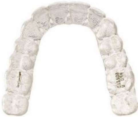
_ Durchsichtige Aligner von Invisalign

Das Invisalign-System ist eine revolutionäre Behandlungsmethode aus den USA, die es Patienten endlich ermöglicht, Zahnfehlstellungen nahezu unsichtbar und komfortabel korrigieren zu lassen. Die glasklaren, hauchdünnen Kunststoffschienen (Aligner) des Invisalign-Systems bewegen die Zähne Schritt für Schritt. Einmal eingesetzt sind sie von Außenstehenden kaum zu sehen und können zum Essen und zur Mundpflege herausgenommen werden. Speziell für Erwachsene und anspruchsvolle Jugendliche stellt das Invisalign-System eine ästhetische Alternative zu herkömmlichen Zahnspangen dar.